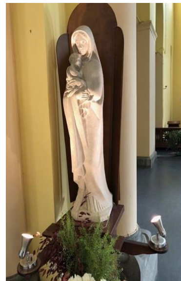
Statue de la Vierge, église Saint-Job