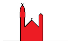
Notre Dame du Rosaire

de 10h à 12h du lundi au vendredi, de 10h à 11h le dimanche